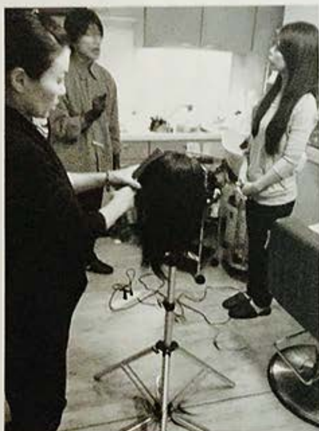
養成スクールでの授業風景。修了者は600人以上