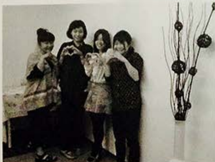
育児退職した女性理美容師の職場復帰にも貢献

「訪問理美容師養成スクール」を開講して優秀な人材の育成・確保にも意欲的に取り組んでいる。スクールでは、理美容師を対象に最長10日間の技術・営業研修を