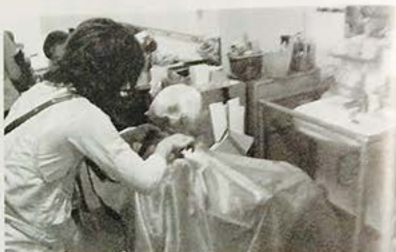
訪問理美容の日はウェルカムボードやアロマ、BGMなど癒しの空間を創出

「介護も理美容も人がすべて」との認識のもと、独自に「訪問理美容師養成スクール」を開講して優秀な人材の育成・確保にも意欲的に取り組んでいる。スクールでは、理美容師を対象に最長10日間の技術・営業研修を