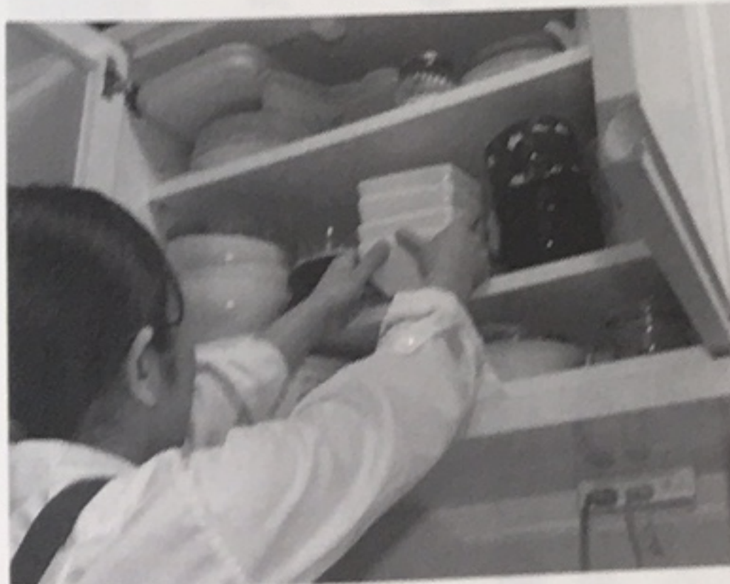
「家事処」では手が届きにくい棚の整理も行う