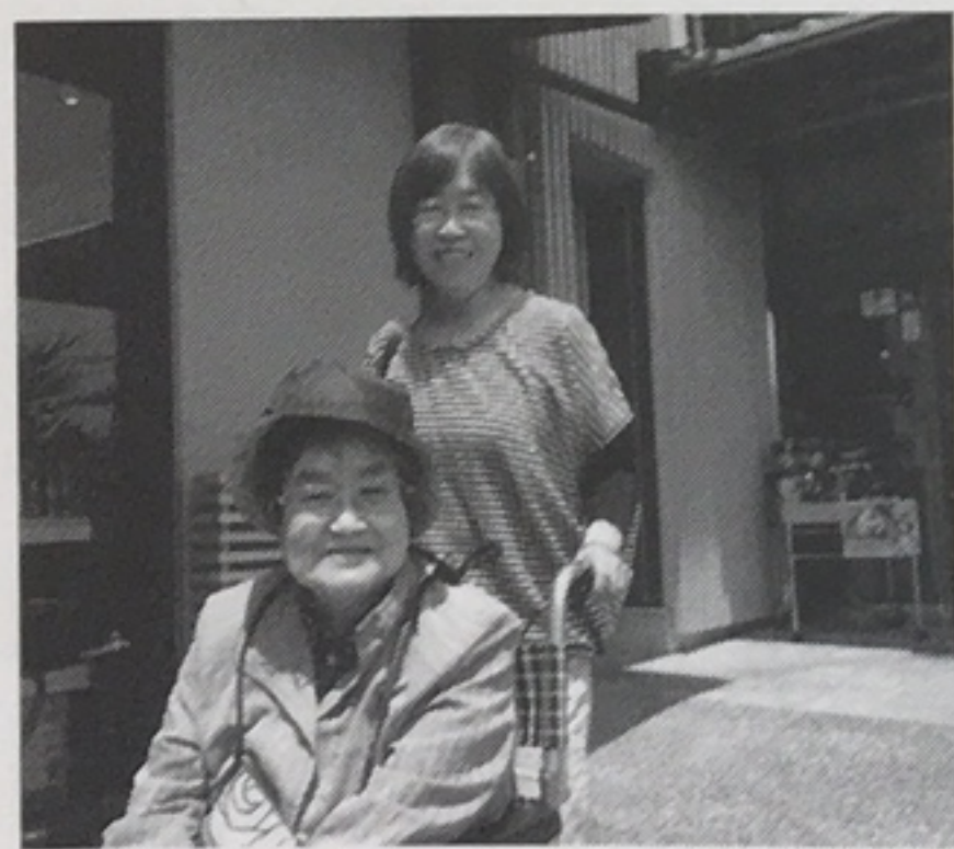
高齢者からの要望が多い介護サービス付き旅行・観光・お出かけサービス

「家族旅行での食事介助や、お墓参りの段差移動の補助、同窓会にお連れするといった多様なニーズに応えるため、時間をかけてカウンセリングし、介護資格を持つスタッフが同行しています。人手が足りず、残念ながらお断りすることも多いのが現状ですが、月あたり約10件のサポートを行っています」 さらに、高齢者住宅・介護