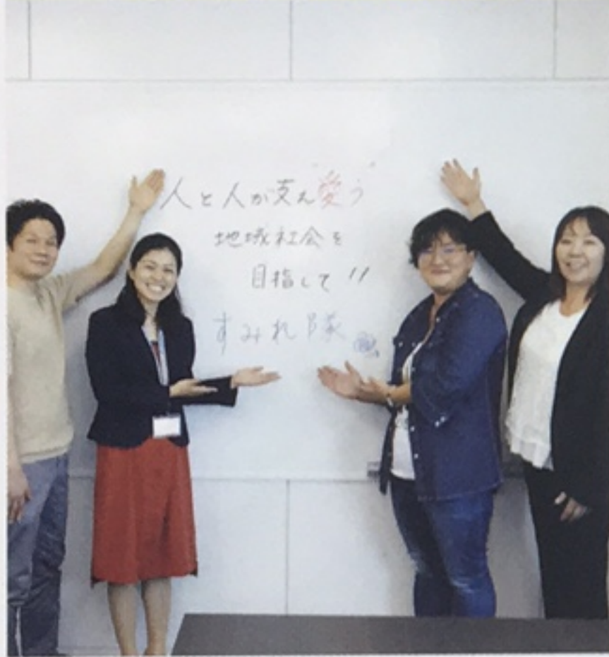
はっぴねす事業協同組合 すみれ隊